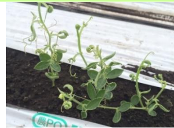
品目：スイートピー 症状：葉の異常