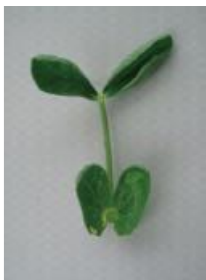
カップ状からさらに変形 =2