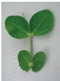
わずかにカップ状 =0.5