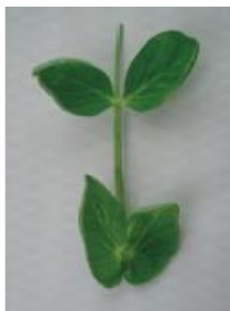
明らかにカップ状 =1