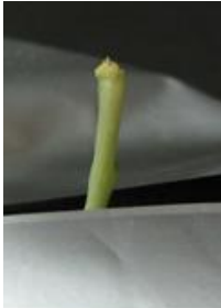
展葉なし（芯止まり） =4