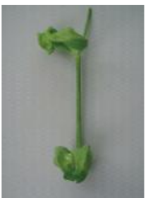
ひどく変形し原型をとどめない =3